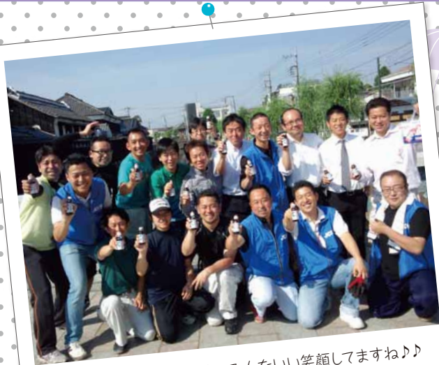
鯉のぼり撤去作業後の一枚。みんないい笑顔してますね♪♪ ファイト〜一発!!