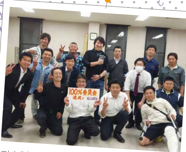
ついにやりましたよ!向上心委員会も100%委員会達成です。 チームワークの良さが伝わってきますね。