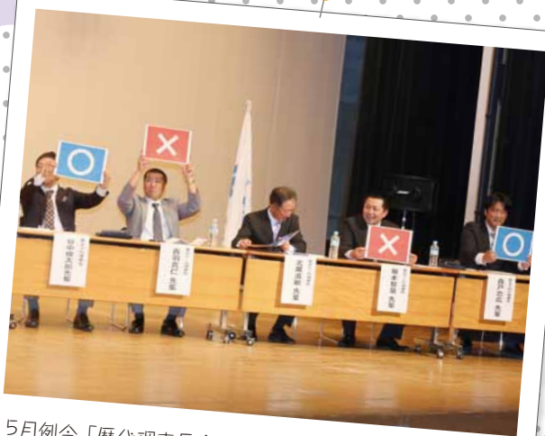
5月例会「歴代理事長座談会」での様子。歴代理事長の皆様格好よかったです☆