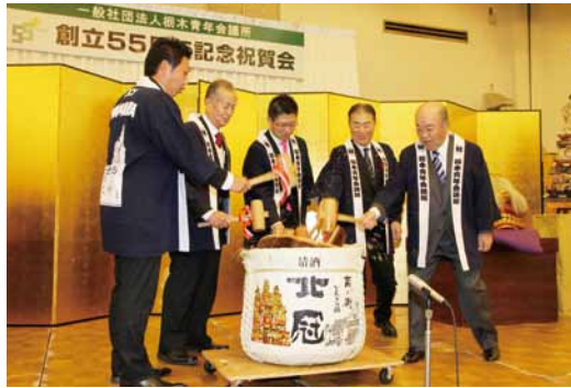
▲創立55周年記念祝賀会 鏡割り

55年という長い歴史の中に様々な事があったのだろう。言葉では表されぬようなものが、それは、諸先輩方の心の中にそと閉まっていたのである。もちろん一人ひとり違った想いが。周年式典、祝賀会という僅かな時間であったが少し見えたような気がした。我々、現役メンバーはこれからのような道を歩いて行くのだろうか？ それは、誰もわからない。しかし、自分の中で「確かな一歩を踏み出せた」と思えた一日だった。 (文/堀江貴浩)