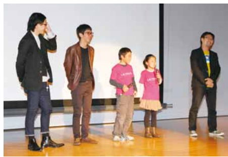
▲上映後のトークショー